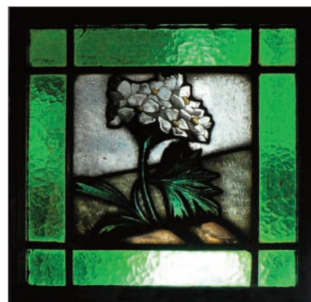
Dřevěné plastiky a skleněné vitráže mohli vidět poslední hosté na jaře 2007

da v tržním prostředí v průběhu desetiletí reagovala na přirozené změny poptávky. Vytvářený zisk by průběžně udržoval Petrovku v konkurenceschopném stavu, jak to známe u alpských domů s nepřerušovanou tradicí. Zodpovědní majitelé by již dávno vyřešili energeticky šetrnější vytápění a ohřev vody, citlivé zateplení boudy, modernizaci pokojů na současný standard a vylepšování kvality služeb. Dnes zanedbanou Petrovu boudu zachrání