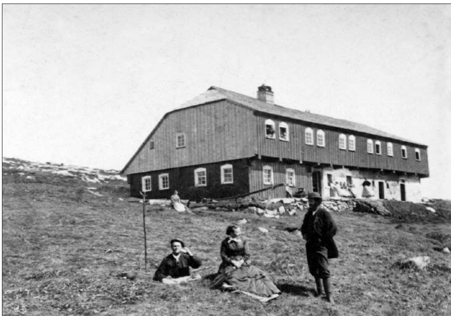
archiv Pavel Klimeš – Veselý výlet