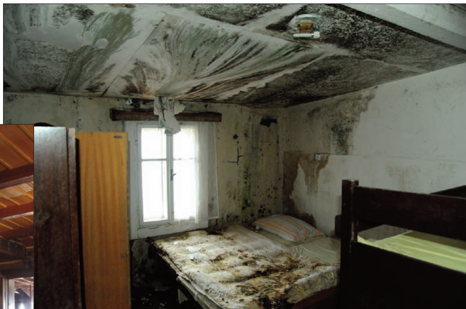
Veselý výlet

▼ Zpustlý hlavním sál restaurace – s prázdnými okny na verandu. Návěští u cesty neláká hosty, ale naopak preventivně odrazuje