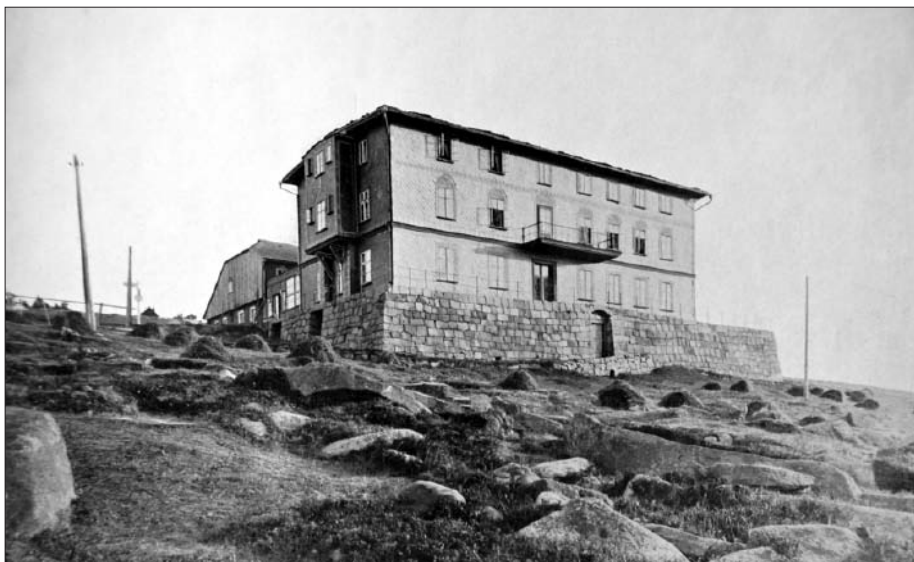
První moderní stavba na hřebenech Krkonoš z roku 1887 zatím ještě stojí

z Jagniątkowa i ze Špindlerova Mlýna. Díky tomu v době největšího turistického rozmachu zcela správně Vinzenz Zinecker v roce 1901 rozšířil Petrovku o druhý podobný objekt na místě původní boudy z roku 1811. Vyhnul se tehdy běžnému zvětšování objemu již kapacitně nedostačujícího domu a novým horním domem navázal na moderní pojetí nejen plochou střechou, ale třeba i členitější fasádou, zdvojenými okny a chytře řešeným středovým objektem propojujícím obě stavby. V roce 1929 jeho syny přistavěný třetí objekt už zdaleka neměl takovou invenci jako stavby provedené zakladatelem moderní Petrovky.