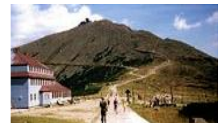
Schneekoppe 1602m höchster Berg im Riesengebirge